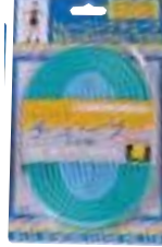
ライトグリーン グリーン 1m+2mの2本組