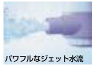
パワフルなジェット水流

取り付け 取り外し 吸盤でしっかりピタッ。はずすときは取っ手を握り、レバーを引くだけ。 注) 木製の浴槽には取り付けられません。