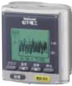
ナショナル 一体型手くび血圧計 EW-3040P ¥17,500