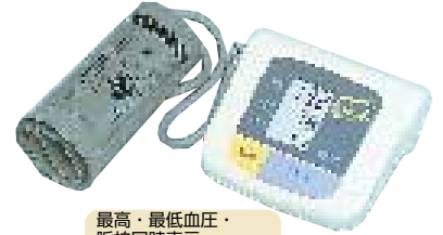
最高・最低血圧・脈拍同時表示 比べやすい前回値表示 エーアンドデイ デジタル血圧計 UA-631 4981046026109 ¥12,000