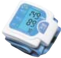
バックライト液晶表示 オムロン デジタル血圧計 手首 UB-401 4981046024105 ¥14,500