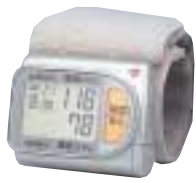
オムロン デジタル血圧計 手首 HEM-630 4975479415579 ¥12,500