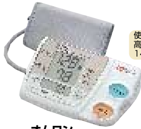
オムロン デジタル血圧計 HEM-757 4975479415548 ¥12,500