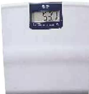
デジタルヘルスマーター 家庭用 32mm大型表示 THD-646 4904785864603 ¥8,000