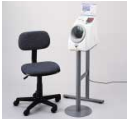
全自動血圧計 BPM AC-03P ¥350,000