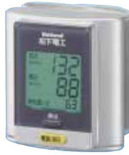
ナショナル 一体型手くび血圧計 EW3030P ¥11,700