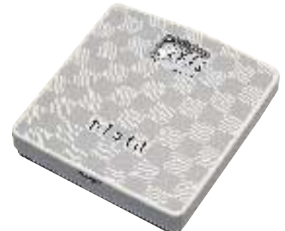
ヘルスマーター 家庭用 アナログタイプ HMT-1536 4904785153622 ¥4,200