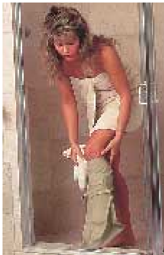
ギプスや包帯のまま、シャワーや入浴ができます。