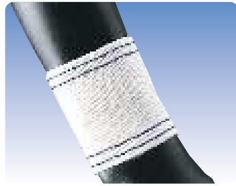
No.450 ホワイト イエロー グリーン サックス ネイビー エンジ