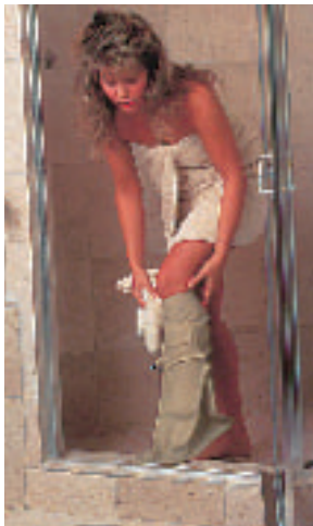
ギプスや包帯のまま、シャワーや入浴ができます。